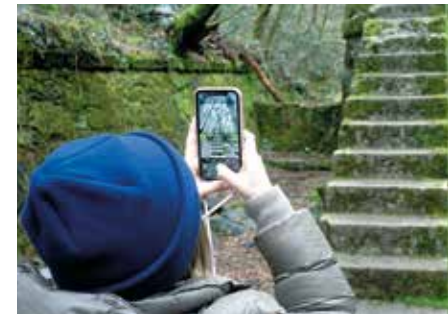
Chemin le long de l'aqueduc de Colognole