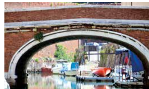
Ponte dei Domenicani, Quartier de la Venezia

«Si j'étais livournais, de ces véritables livournais qui disent dé et parlent les mains ouvertes, en bougeant les doigts, comme pour montrer qu'il n'y a aucune entourloupe dans leurs paroles, je voudrais me sentir chez moi à chaque Scalo de la Venezia».