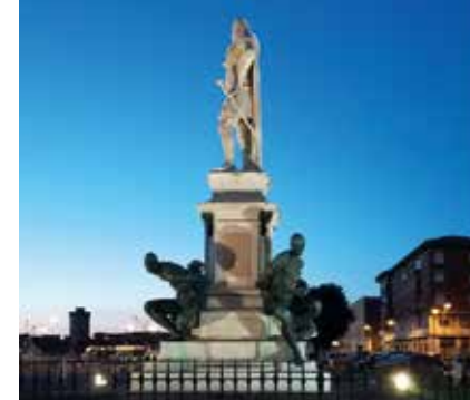
Sculpté des Quattro Mori

Ville conçue et désirée par les premiers grands-ducs de Toscane, dessinée dans la perfection d'un pentagone, Livourne est comme un joyau enchâssé entre le vert des collines et le bleu de la mer. C'est cette dernière semblant, depuis le rivage, être sans limites, qui a amené des peuples et des traditions de terres lointaines. Tous les visiteurs accueillis sont arrivés avec des ambitions et des destinées variées, invités en 1591 par le grand-duc Ferdinand I de Médicis, qui avec ses Leggi livornine (lois livournaises) révolutionnaires, attira des individus du monde entier pour donner vie à une nouvelle ville, refuge de paix, de travail et de prospérité. Les juifs, qui ne furent pas relégués dans des ghettos, vécurent et travaillèrent aux côtés de marins grecs, de marchands arméniens et turcs, de commandants français et anglais. Fondée en 1590, Livourne est une ville de la Renaissance par excellence : ses rues sont droites, larges et dégagées, la lumière coule à flots et il y a toujours dans l'air l'odeur de la brise marine. Le même Ferdinand I fit d'elle une terre sûre, protégée des attaques des pirates mauresques. Aujourd'hui, son effigie de marbre en témoigne encore, à l'entrée du port, au sein du magnifique ensemble sculpté des Quatro Morri (Quatre Maures) du maître Pietro Tacca. Le centre historique est un cœur palpitant