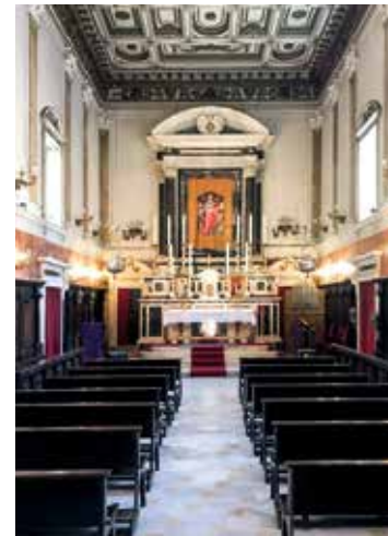
Église Santa Giulia

Livourne est une des 25 étapes de cet itinéraire symbolique qui depuis la Toscane arrive en Lombardie en passant par l'Emilie, reliant des lieux historiques et religieux consacrés à la dévotion de Santa Giulia. De la mer à la montagne jusqu'à la plaine, le voyage est une expérience dotée d'une grande valeur spirituelle, historique et environnementale.