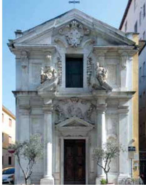
Église Greci Uniti

Le voyageur étranger peut toujours trouver à Livourne quelque chose de sa terre d'origine : une tradition, une personnalité, une église, un vieux cimetière, des odeurs et des couleurs. La via della Madonna, perpendiculaire à la rue principale du centre, renferme, telle un écrin, des églises et des autels des anciennes communautés étrangères présentes dans la ville depuis les années 1600. L'une tout près de l'autre, on remarque l'église des Greci Uniti et celle de la Madonna avec les autels des Nations étrangères et la façade baroque de la Nation Arménienne. Rapidement, au-delà du secteur marchand, on arrive à une imposante synagogue moderne, à l'architecture indubitablement singulière qui symbolise la grande tente qui abritait l'Arche de l'Alliance. La Synagogue se trouve dans le même pâté de maisons que le Duomo du XVIIIe siècle, ce qui confirme le degré de considération qu'éprouvait toute la population envers la communauté juive. Une autre visite à ne pas manquer est l'église Santa Giulia, dédiée à la patronne de la ville, dont l'histoire est liée à celle de la Méditerranée. Le petit lieu de culte se dresse aux côtés