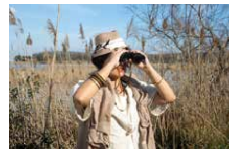
Réserve naturelle de Oasi della Contessa

Depuis le cœur des collines, un réseau de sentiers de randonnées serpente ; il permet d'apprécier cette île verte, lieu idéal pour une reconnexion complète avec la Nature vierge. À pied, à vélo ou à cheval, on peut arriver à Livourne en suivant le tracé de l'ancien Aqueduc Leopoldino, qui longe bois et cours d'eau, avant de rejoindre la mer. L'itinéraire traverse le Parc des Monti Livornesi, zone protégée, parcourue par des sangliers, renards et belettes qui se déplacent entre les genêts colorés et les forêts de chênes verts et de lièges. Pour les amoureux des activités de plein air, on conseille sans hésiter l'expérience de l'Oasi della Contessa, une réserve naturelle régionale qui subsiste, tel un dernier témoignage du marécage côtier qui couvrait cette région. Le secteur est équipé pour l'observation d'oiseaux et permet de guetter le repos de nombreuses espèces qui font halte dans ce lieu durant leur migration. Seul ou en groupe, accompagnés par les guides qui animent aussi des activités pour les plus petits, il est possible d'observer hérons et Rolliers d'Europe et découvrir la végétation typique de cet habitat naturel extraordinaire.