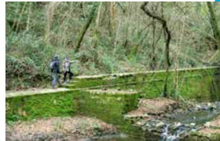
Chemin le long de l'aqueduc de Colognole

On retrouve le toponyme pour la première fois en 1272, «Collis Salvecti», dans un contrat pour une vente de terrains, rédigé par le «notaire Salvetto, fils de Borgo, à la Villa Colle». Après la victoire de Florence, Colle devient ville des Médicis, résidence de chasse et centre moteur de l'exploitation grand-ducale, d'abord médicéenne puis lorraine, qui à l'apogée de son expansion comptait plus de vingt fermes.