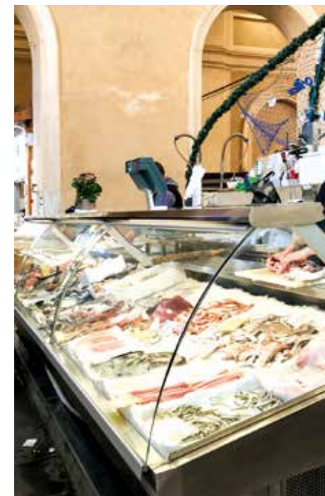
Salone del Pesce

Lorsqu'il fut construit par son architecte Angelo Badaloni, à la fin du XIXe siècle, ce marché alimentaire (Mercato delle Vettovaglie) était un des plus grands d'Europe, réalisé avec les matériaux les plus avant-gardistes de l'époque: fer, fonte et verre composent l'édifice que les Livournais surnommèrent le «petit Louvre». Sa magnificence et le style floral de ses poutrelles métalliques rendent agréable le brouhaha environnant des commerçants, prêts à garantir l'exclusivité de leurs produits. Les primeurs de la mer s'achètent parmi les comptoirs de marbre du Salone del Pesce, où on trouve à bon prix la pêche du jour, matière première de la préparation des plats régionaux. Visiter le marché de Livourne constitue une expérience sensorielle: couleurs, parfums et bruits se mélangent, restituant une émotion unique et incomparable qui titille le palais pour que ce dernier goûte les roschette (anneaux de pâte salés) de la cuisine hébraïque, les œufs ultra-blancs de la «poule livournaise», les morceaux de cacciucco ou encore le typique ponce alla livornese.